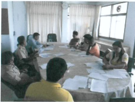
ภาพกิจกรรม

สำนักงานปศสัตว์เขต 1 ร่วมกับสำนักงานปศสัตว์จังหวัดสระบุรี ตรวจติดตามการแก้ไขปัญหาคุณภาพน้ำนม ตามโครงการอาหารเสริม (นม) โรงเรียน โดยเก็บตัวอย่างน้ำนมดิบส่งตรวจห้องปฏิบัติการสำนักตรวจสอบคุณภาพสินค้าปศสัตว์ เมื่อวันที่ 27-28 เมษายน 2559 ในพื้นที่จังหวัดสระบุรี