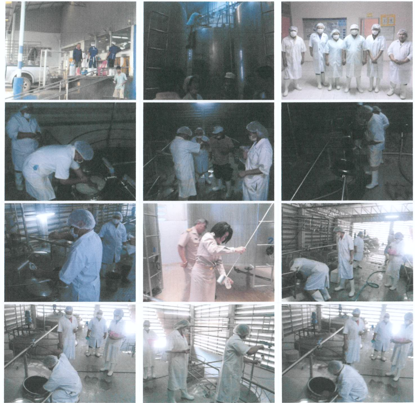
ภาพกิจกรรม

สำนักงานปศสัตว์เขต 1 ร่วมกับสำนักงานปศสัตว์จังหวัดสระบุรี ออกตรวจติดตามการแก้ไขปัญหาคุณภาพน้ำนม ตามโครงการอาหารเสริม (นม) โรงเรียน โดยเก็บตัวอย่างน้ำนมดิบส่งตรวจห้องปฏิบัติการสำนักตรวจสอบคุณภาพสินค้าปศสัตว์ เมื่อวันที่ 21-22 มิถุนายน 2559 ในพื้นที่จังหวัดสระบุรี