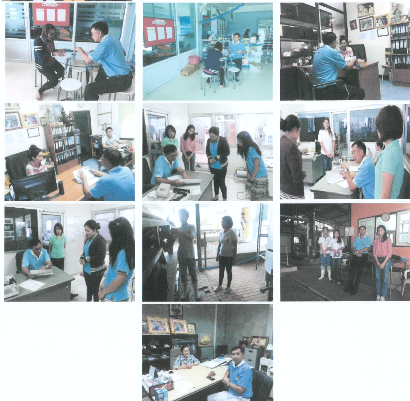
ภาพกิจกรรม

ส่วนยุทธศาสตร์และสารสนเทศการปศุสัตว์ สำนักงานปศุสัตว์เขต 1 ออกตรวจติดตามการแก้ไขปัญหาคุณภาพน้ำนม ตามโครงการอาหารเสริม (นม) โรงเรียน ที่สหกรณ์โคนมไทย-เดนมาร์ก ก.น.ช. หนองรี จำกัด บริษัท พี.วี.พัฒนานมสด จำกัด จังหวัดลพบุรี บริษัท เทียนชา แดรี่ คอร์ปอเรชั่น จำกัด และบริษัท ส่งเสริมผลิตภัณฑ์นม จำกัด (สาขาสาฟญากลาง) จังหวัดสระบุรี ระหว่างวันที่ 7-8 กันยายน 2559